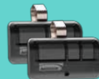
Control remoto MAX de 3 botones (893MAXLMK)